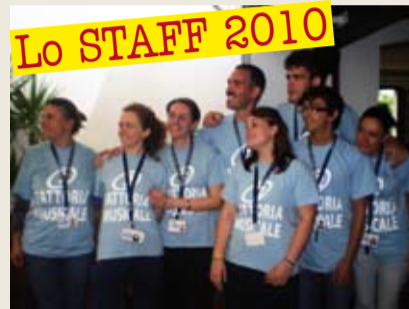
Lo STAFF 2010

Simpatici, sorridenti, disponibili.. e anche belli!!