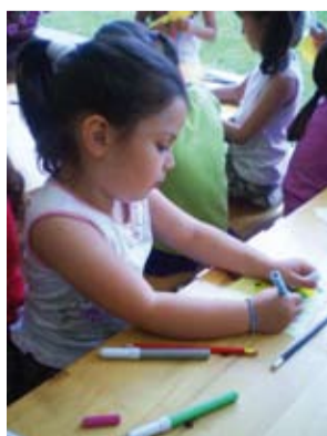
momenti di creativitа'