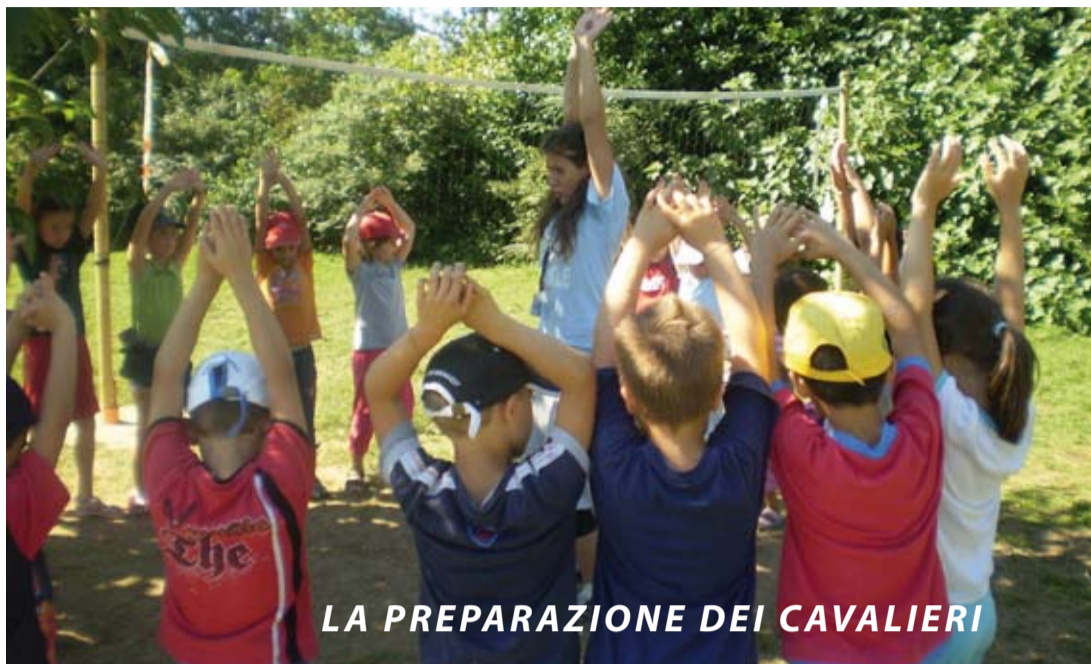
LA PREPARAZIONE DEI CAVALIERI