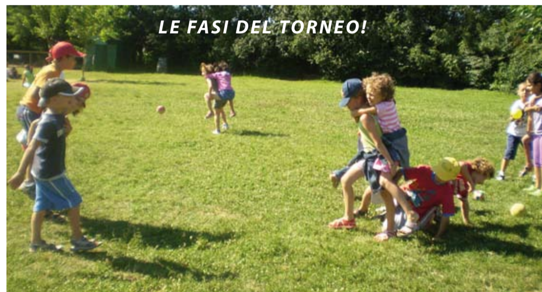
LE FASI DEL TORNEO!