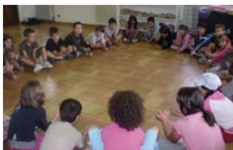
un momento del Laboratorio PLAYMUSIC

Dall'utilizzo di semplici strumenti percussivi fino ai canti corali, in perfetta integrazione con gli argomenti trattati al campo estivo, il laboratorio mira a infondere nel bambino un senso di appartenenza e familiarità con l'attività creativa musicale , nonché un'educazione all'ascolto che si rivelerà fondamentale nello sviluppo di una sensibilità a tutto campo per la persona presente e futura integrata nel mondo circostante.